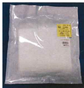
エレファーゼ滅菌ガーゼ 30cm×30cm 10枚 4折×2組入 472円