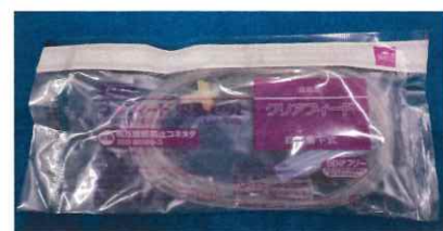
TOP ネオフィード栄養セット チューブ1本 157円