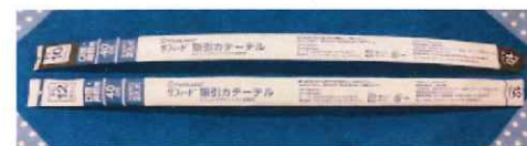
サフィード 吸引カテーテル 口腔・鼻腔用 Fr10 88円 Fr12 88円