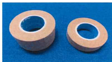
3M マイクロポアスキントーン サージカルテープ No.1533-0 1.25cm幅 226円 No.1533-1 2.5cm幅 446円