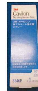
キャビロン 非アルコール性 皮膚スプレー 28ml 2,200円