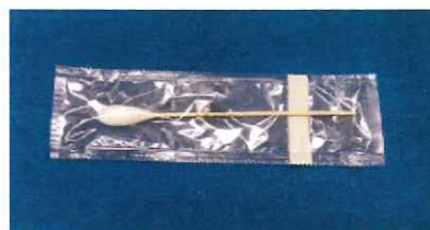
滅菌めん棒(大) No. 13 1本入 47円