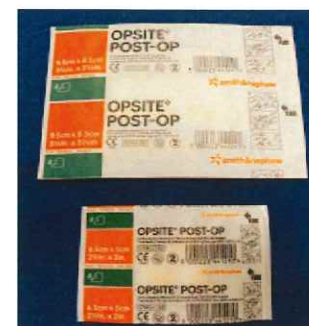
オプサイト ポストオプ 防水テープ 9.5cm×8.5cm 1枚 210円 6.5cm×5cm 1枚 105円