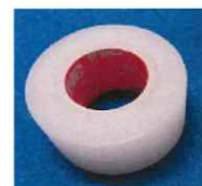
3M トランスポアサージカルテープ No.1527-1 2.5cm幅 336円