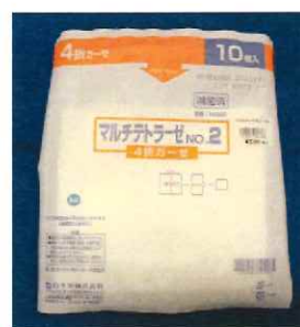
マルチテトラゼNo. 2 滅菌ガーゼ 30cm×30cm 1枚4折 10組入 336円