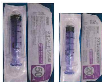
TOP ネオフィードシリンジ (注入器) 50ml 1本 135円 20ml 1本 135円