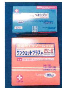
ワンショットプラス ヘキジン60包 880円 EL-II (エタノール) 100包 1,100円