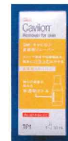
キャビロン 皮膚用リムーバー 30ml 1,430円