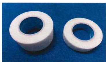
3M マイクロポアテープ No.1530-0 1.25cm幅 142円 No.1530-1 2.5cm幅 278円