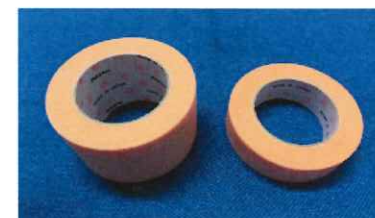
ニトリート 優肌絆 サージカルテープ No.3251 1.2cm幅 116円 No.3252 2.5cm幅 226円