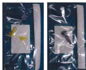
JMS EN変換コネクタ Aタイプ・Bタイプ