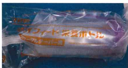
TOP ネオフィード栄養ボトル600ml 1本 432円