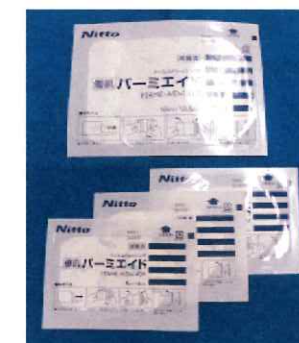
パーメイド フィルムドレッシング 防水テープ No.1413 10cm×13.5cm 1枚 241円 No.1409 6cm×9cm 3枚 355円