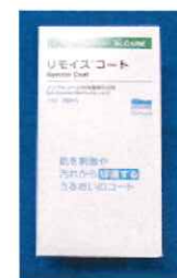
リモiscoat ノンアルコール性 保護膜形成剤 30ml 1,760円