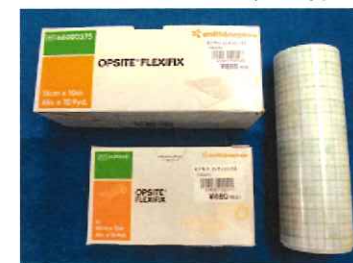
オプサイト フレキシフィックス 防水テープ ロールタイプ 10cm幅×1m 660円 15cm幅×1m 880円