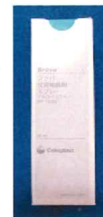
ブラハ 皮膚被膜剤スプレー アルコールフリー 50ml 2,178円