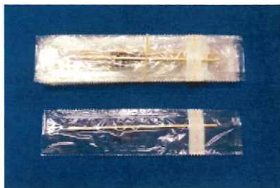
滅菌めん棒(小) 10本組 No. 10 153円