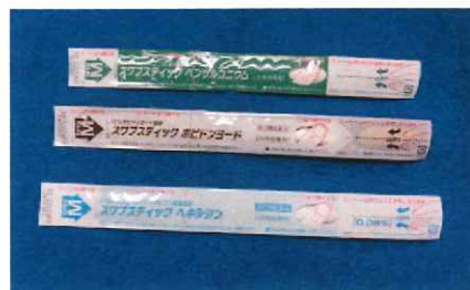
スワブステック 3種 66円