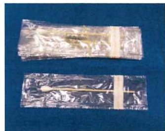
滅菌めん棒(中) 6本組 No. 12 116円